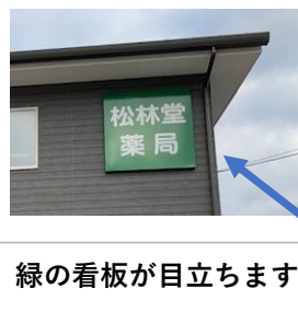
緑の看板が目立ちます