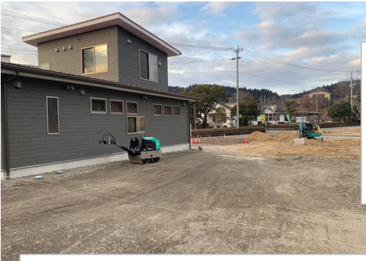
現在整地中で、 ロータリーと患 者さん駐車場に なる予定です。

玄関入口のスロープ工事の様子です。左上写真の手前側に患者さん駐車場ができるため、こちら側にスロープを設置します。逆に現在使用している道路側からの入口は、階段になる予定です。