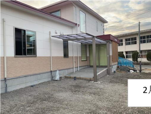
2月7日朝の写真です